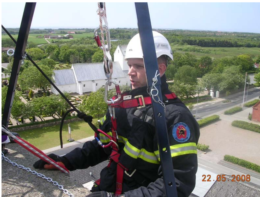
Det første "skridt" er taget, så er det bare med at komme ned.