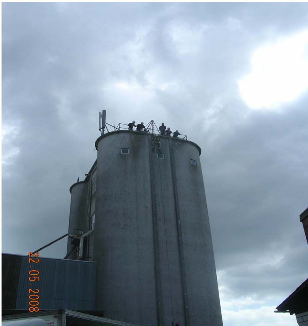
På en af de sidste dage kørte vi ud til en gammel nedlagt silo, og brugte den til diverse opgaveløsninger, blandt andet nedfiring til strandet person på ydersiden af silo.