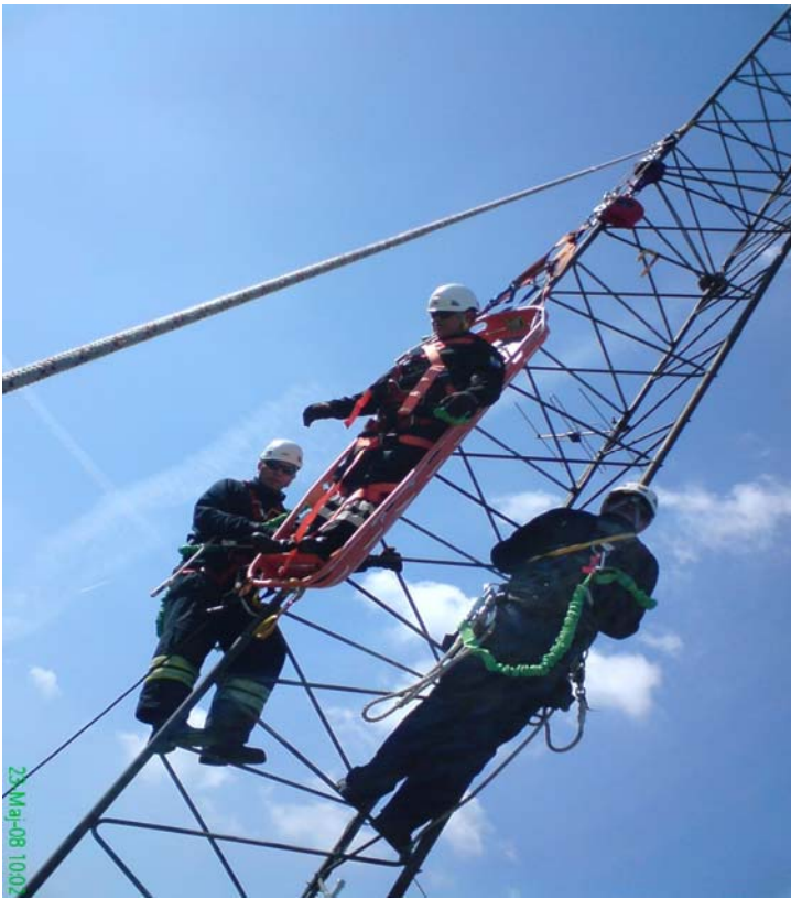
Redning fra antennemast med nedtagning af patient i redningsbåre.

Alt i alt et fantastisk spændende men også udfordrende kursus, som til fulde levede op til vores bedste forventninger om at komme ud og klatre.